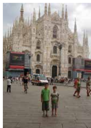
Ιταλία - Ντουόμο, Μιλάνο, 2008