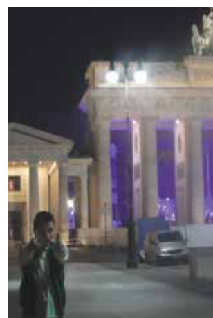
Πύλη Βραδεμβούργου, 2014