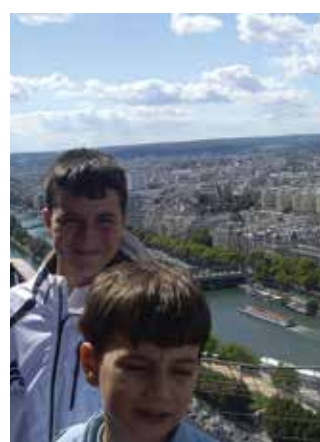
Γαλλία - Σκουάνας, 2010