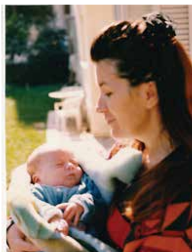
Στη ζεστή αγκαλιά της μαμάς

Είκοσι όμορφα χρόνια περάσαμε μαζί καλέ μας άγγελε. Είκοσι χρόνια που μας γέμισες χαρές και δημιουργία. Πώς να μη θυμόμαστε τα παιδικά σου πάρτυ, που γέμιζε το γκαζόν στην αυλή μας με τους λιλιπούτειους φίλους σου, με τα μπαλόνια, τις κορδέλλες και τις ατάλειωτες χαρούμενες φωνούλες! Πώς να μη θυμόμαστε τις εκδρομές, τα παιχνίδια με το χιόνι, πώς να ξεχάσουμε το όμορφο χαμόγελό σου, όταν με ικανοποίηση μάς έφερνες τους ελέγχους σου και καμάρωνες για τα δεκάκια σου. Έξι ολόκληρα χρόνια, ούτε ένα εννιά, αλλά ούτε και μία απουσία! Πώς να μη θυμόμαστε έναν ταλαντούχο ποδοσφαιριστή, έναν αέρινο δρομέα, βραβευμένο με μετάλλια του ΣΕΓΑΣ! Μαζί με το μικρό σου αδελφό ξεκοκκαλίζατε τον «Μικρό Εξερευνητή» και εντοπίζατε στο χάρτη τα μέρη με τα αξιοθέατα που θέλατε να πάμε. Εσείς δίνατε την εντολή και οργανώνατε τα ταξίδια, εμείς ουσιαστικά σας ακολουθούσαμε, όσο απίστευτο κι αν ακούγεται αυτό. Κι έμελλε να οργώσουμε σχεδόν ολόκληρη την Ευρώπη. Με αεροπλάνο στις πιο απομακρυσμένες πόλεις της βόρειας Ευρώπης κι από εκεί με τα υπερσύγχρονα τρέινα τους διασχίζαμε χώρες ολόκληρες με ενδιαμέσους σταθμούς που εσείς επιλέγατε. Όπου αξιοθέατο και στάση, όπου κοσμοπλημμύρα κι εμείς ανάμεσά τους.