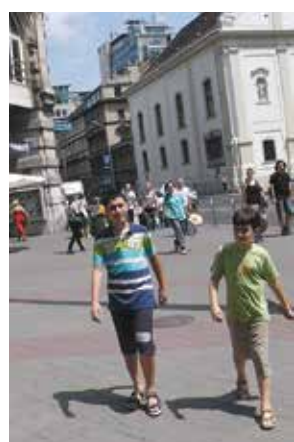
Ουγγαρία - Βουδαπέστη, 2012