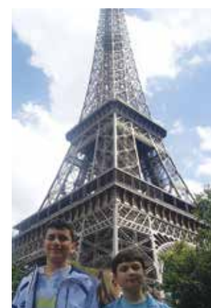
Γαλλία - Πύργος Αίφελ, 2010