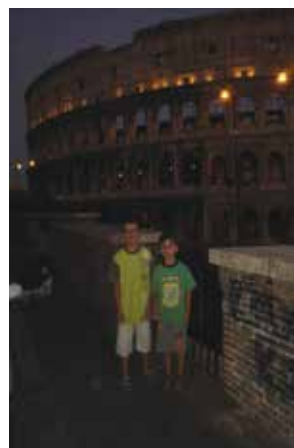
Ρώμη - Κολλοσέο, 2008