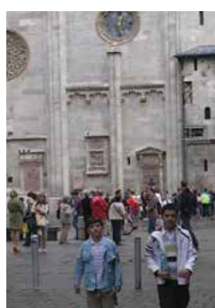
Αυστρία - Βιέννη, 2012