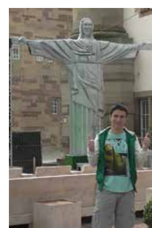
Γερμανία -Στουτγάρδη, 2014