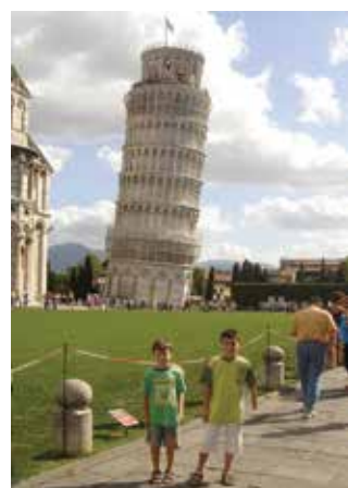
Ιταλία - Πύργος Πίζας, 2008