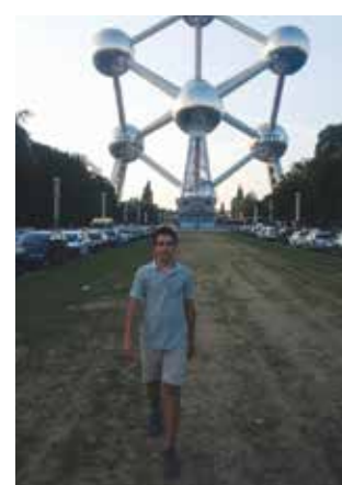
Βέλγιο - Βρυξέλλες, 2013