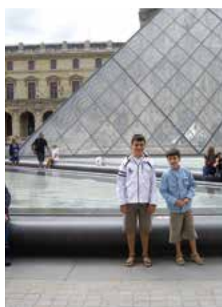
Γαλλία - Παρίσι, 2010