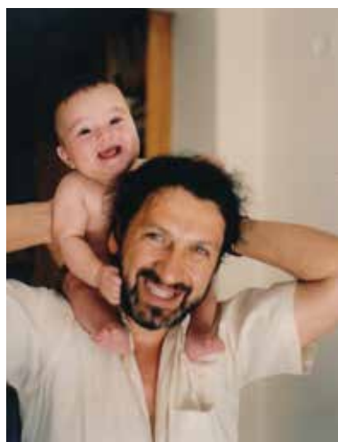
Το πιο όμορφο βάρος