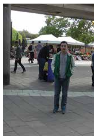
Σουηδία - Στοκχόλμη, 2014