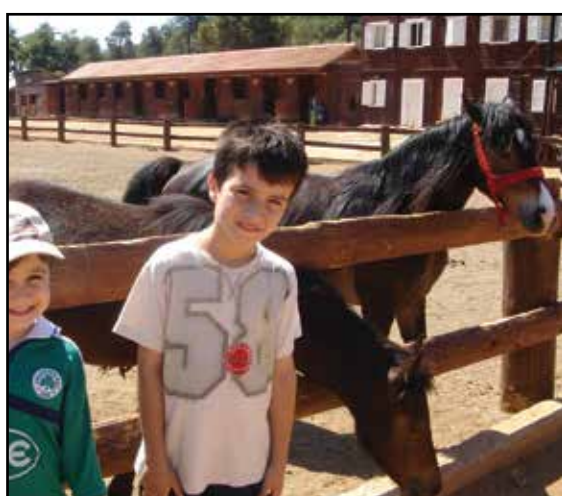
Εκδρομή στο Σοφικό