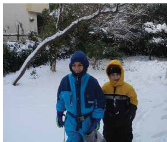
Στη χιονισμένη αυλή μας στο Χαλάνδρι