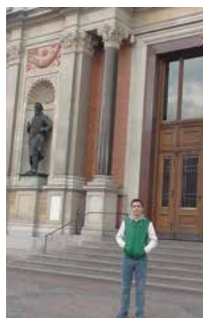
Γερμανία - Βερολίνο, 2014