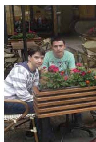
Τσεχία - Πράγα, 2014