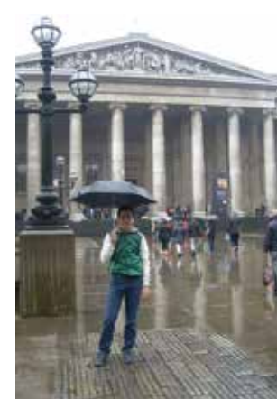
Αγγλία - Λονδίνο, 2013