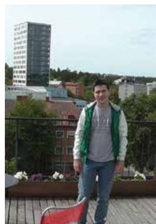
Δανία - Κοπεγχάγη, 2014