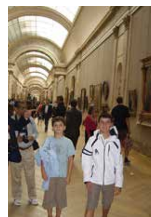
Γαλλία - Λούβρο, 2010